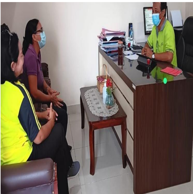
Gambar 1. Komunikasi Primer

Adapun bentuk komunikasi interpersonal primer yang diterapkan oleh Penyuluh Keluarga Berencana adalah komunikasi verbal dan nonverbal yaitu menggunakan bahasa langsung dan menggunakan media dalam menjangkau kelompok unmet need saat penelitian yang dilakukann di Desa Sayan Kecamatan Ubud Kabupaten.