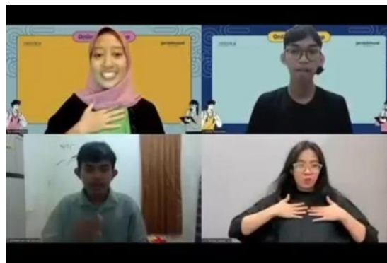
Gambar 2. Penggunaan Bahasa Isyarat

diperlakukan sebagai bagian dari satu keluarga besar.”