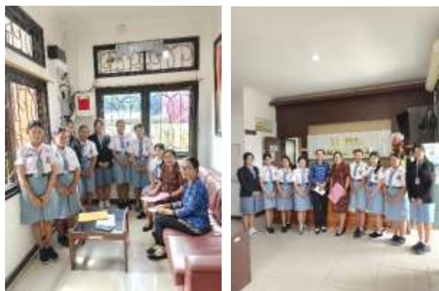
Gambar 4: Guru Pembimbing Memberikan Evaluasi Terhadap Kinerja Siswa Selama Melaksanakan PKL

adanya keterpaduan antara kurikulum sekolah dengan kebutuhan kerja di instansi pemerintah, sehingga tujuan link and match dalam pendidikan kejuruan dapat tercapai. Aspek pembimbingan juga menjadi faktor penting dalam keberhasilan PKL. Pembimbing lapangan di Bappeda memberikan arahan, pendampingan, serta pengawasan yang cukup intensif kepada siswa. Melalui bimbingan tersebut, siswa memperoleh pemahaman yang lebih baik mengenai tugas dan tanggung jawabnya, sekaligus mendapatkan umpan balik untuk meningkatkan kualitas kinerja. Namun demikian, terdapat beberapa keterbatasan, seperti waktu pembimbingan yang terbagi dengan tugas utama pegawai serta keterbatasan akses siswa terhadap dokumen tertentu yang bersifat rahasia. Kendala ini menjadi bagian dari dinamika PKL di instansi pemerintah dan perlu dipahami sebagai bagian dari proses pembelajaran siswa. Lingkungan kerja di Bappeda Kabupaten Gianyar dinilai kondusif dan mendukung proses pembelajaran siswa. Suasana kerja yang tertib, profesional, serta adanya sikap terbuka dari pegawai mendorong siswa untuk lebih aktif belajar dan beradaptasi. Berdasarkan hasil evaluasi tersebut, dapat disimpulkan bahwa pelaksanaan PKL telah memberikan manfaat yang signifikan bagi siswa, meskipun masih diperlukan peningkatan koordinasi antara sekolah dan instansi mitra untuk mengoptimalkan pelaksanaan PKL di masa mendatang.