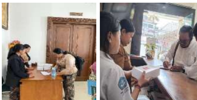
Gambar 5 : Siswa SMKN 1 Gianyar Memberikan Pelayanan Prima Kepada Tamu yang Berkunjung Sebagai Bentuk Praktik Ajaran Agama Hindu Dalam Melayani Sesama

Adapun nilai kayika tercermin dari sikap dan perilaku siswa dalam melaksanakan setiap pekerjaan dengan penuh tanggung jawab, kejujuran, dan kesungguhan. Siswa tidak hanya menjalankan tugas secara teknis, tetapi juga menunjukkan etos kerja yang baik, kedisiplinan waktu, serta kepedulian terhadap lingkungan kerja. Tindakan nyata yang dilakukan dengan penuh kesadaran ini menjadi wujud implementasi ajaran Hindu dalam praktik kehidupan sehari-hari. Selain Tri Kaya Parisudha pelaksanaan PKL juga mengandung nilai Catur Guru , khususnya Guru Wisesa (pemerintah). Hal ini tercermin dari sikap hormat, taat, dan patuh siswa terhadap aturan, tata tertib, serta kebijakan yang berlaku di instansi pemerintah tempat mereka melaksanakan PKL. Dengan mematuhi peraturan dan menjalankan tugas sesuai prosedur, siswa belajar memahami pentingnya peran pemerintah sebagai pengayom masyarakat serta penegak tatanan kehidupan berbangsa dan bernegara. Dengan demikian, pelaksanaan PKL tidak hanya berfungsi sebagai sarana untuk meningkatkan kompetensi kerja, keterampilan, dan pengalaman siswa di dunia kerja, tetapi juga menjadi media pembelajaran yang efektif dalam menanamkan serta mengimplementasikan nilai-nilai moral, etika, dan spiritual Hindu. Nilai-nilai tersebut diharapkan dapat membentuk karakter siswa yang profesional, berakhlak mulia, dan siap mengamalkan ajaran agama Hindu dalam kehidupan kerja maupun kehidupan bermasyarakat.