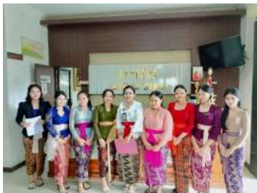
Gambar 3: Guru Pembimbing Selalu Datang Memonitoring Siswa PKL, Sebagai Bentuk Tanggung Jawab Terhadap Siswa Terutama dalam Kontrol Sikap dan Karakter Kerja