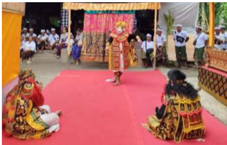
Gambar 1. Pementasan Dramatari Topeng Adegan Petangkilan Dalem dan Penasar

seseorang dalam menggunakan bahasa Bali secara tepat memperlihatkan "kedudukan sosial dan etika" orang tersebut. Dengan demikian, bahasa dalam dramatari topeng berfungsi sebagai penanda status ( status marker ) yang mengajarkan penonton untuk memberikan penghormatan ( Bhakti ) kepada figur yang dimuliakan, sebuah prinsip fundamental dalam ajaran Catur Warna .