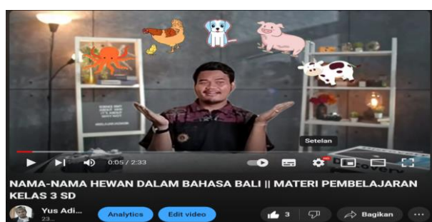
Gambar 7. Screenshot video pembelajaran YouTube