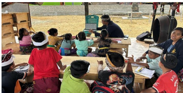
Gambar 5. Pertemuan Kedua