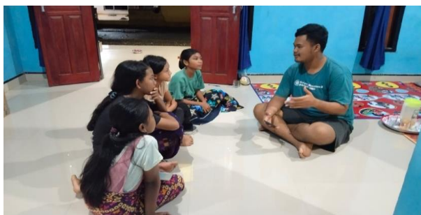
Gambar 4. Wawancara dengan beberapa anak desa Salupangkang

Dengan demikian, penggunaan "Kamus Beburon Berbahasa dan Beraksara Bali" dan video interaktif dalam pengajaran bahasa Bali di Desa Salupangkang telah terbukti efektif dalam meningkatkan minat dan pemahaman anak-anak terhadap materi yang disampaikan. Inovasi ini menunjukkan bahwa penggunaan media yang tepat dapat mengubah dinamika pengajaran, menjadikannya lebih menarik dan relevan bagi siswa, serta membantu dalam pelestarian bahasa dan aksara Bali di kalangan generasi muda.