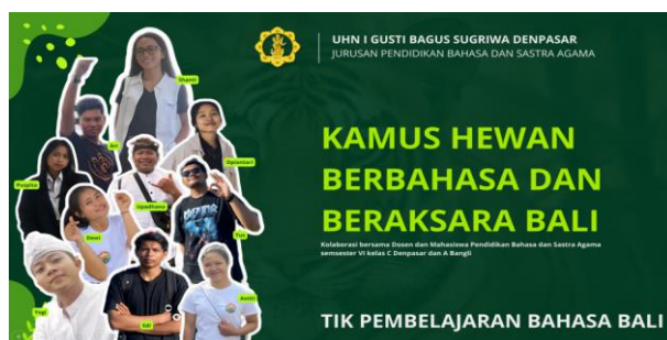
Gambar 1. Cover depan kamus yang berisikan identitas penyusun