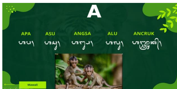
Gambar 3. Slide ketiga yang menjadi menu utama pada kamus dan menjadi fitur hyperlink

Gambar 1, gambar 2, dan gambar 3 di atas hanyalah sekilas gambaran dari keseluruhan isi Kamus Beburon berbahasa dan beraksara Bali, yang terdiri dari total 47 slide. Setiap slide dalam kamus ini dirancang dengan penuh perhatian untuk menghadirkan pengalaman belajar yang menyeluruh dan mendalam. Kamus ini tidak hanya berfungsi sebagai alat bantu pembelajaran, tetapi juga sebagai sarana untuk menghidupkan kembali dan menjaga keberlanjutan bahasa dan aksara Bali di kalangan generasi muda.