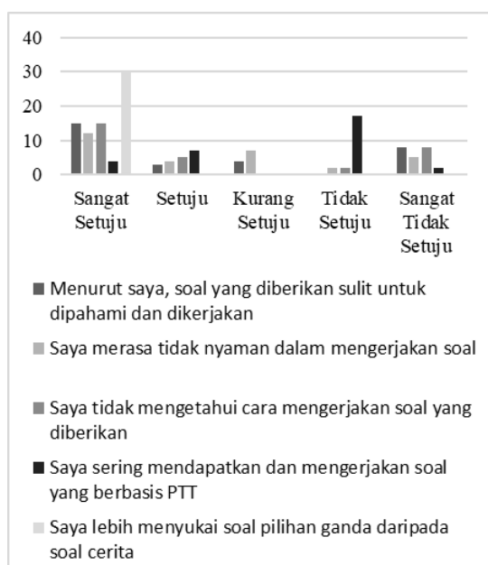
Bagan 2. Angket siswa terkait soal cerita PTT materi operasi hitung saat observasi

Selain itu, berdasarkan hasil angket di atas menunjukkan bahwa kebiasaan mereka untuk mengerjakan soal-soal pilihan ganda menjadikan mereka nyaman dengan bentuk soal tersebut sehingga mereka merasa kurang nyaman ketika harus mengerjakan soal-soal yang berbentuk cerita, bahkan cenderung malas untuk mengerjakannya. Hal ini yang menyebabkan mereka tidak mengetahui bagaimana harus menuliskan cara pengerjaan atau penyelesaian soal karena soal yang berbentuk pilihan ganda tidak mengharuskan mereka