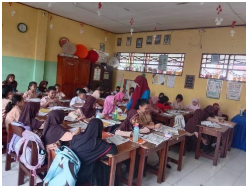
Gambar 3. Situasi kelas saat observasi setelah mengerjakan soal, skala diferensial semantik, dan angket